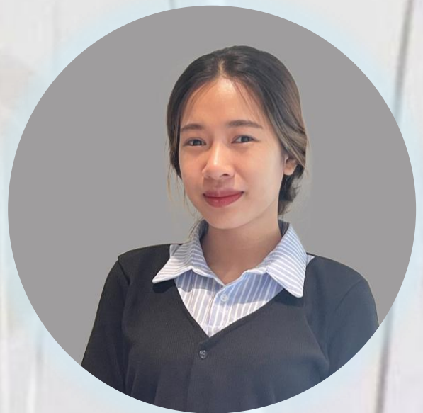
Trà Mi – 12/6